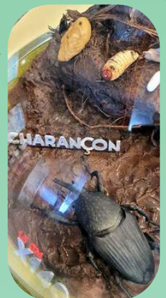
Diorama de charançon