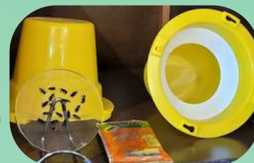
Piège à charançon